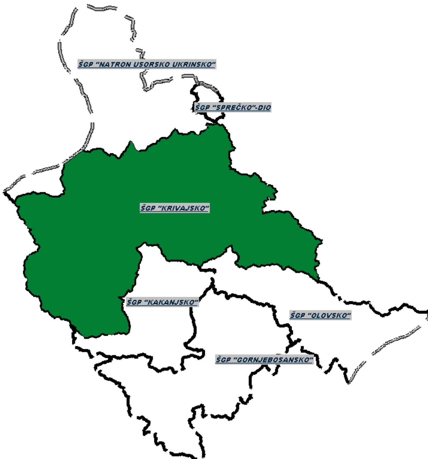
Slika 1. Skica JP „ŠPD ZDK“ d.o.o. Zavidovići