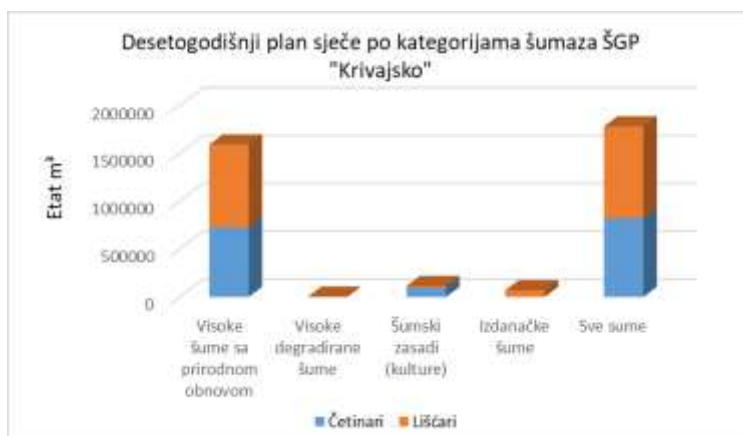
Grafikon 4. Desetogodišnji plan sječa za ŠGP „Krivajsko“