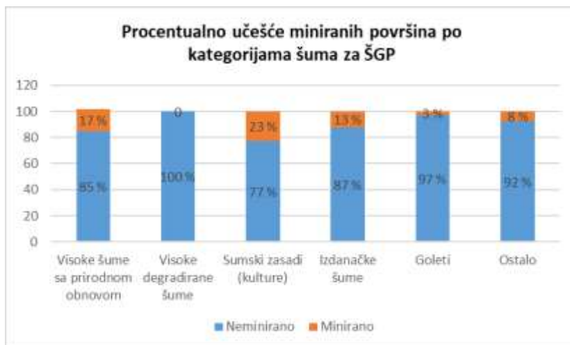
Grafikon 2. Procentualno učešće miniranih i nemiranih površina po kategorijama šuma za ŠGP