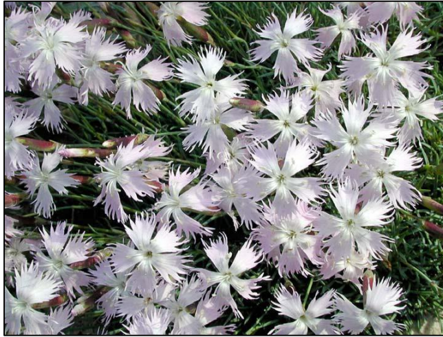
Slika 11. Dianthus petraeus

Ima zeljastu stabiljku visoku do 80 cm. Listovi su zeleni do zeleno-plavi, dugi do 15 cm. Cvjetovi su pojedinačni, bijele boje. Dugi su 3-5 cm.