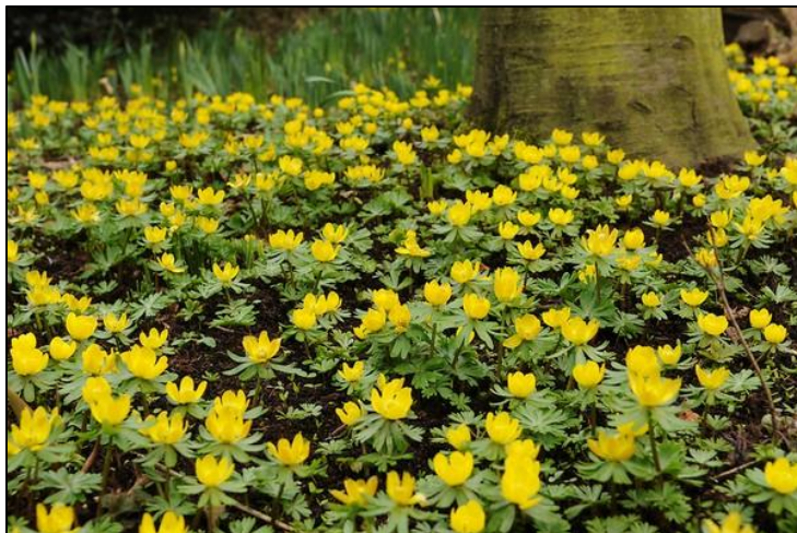
Slika 26. Eranthis hyemalis

Višegodišnja biljka, stabljike su uspravne, šuplje, zelene, a narastu do 15 cm visine. Prizemni listovi se nalaze na dugačkoj peteljci, srcolikog su oblika. Cvjetovi su veliki do 5 cm, sačinjeni od 6 jajolikih žutih latica, veličine do 2 cm. Cvate od kraja februara do aprila. Plod čini nekoliko čahura u kojima se nalaze sjemenke.