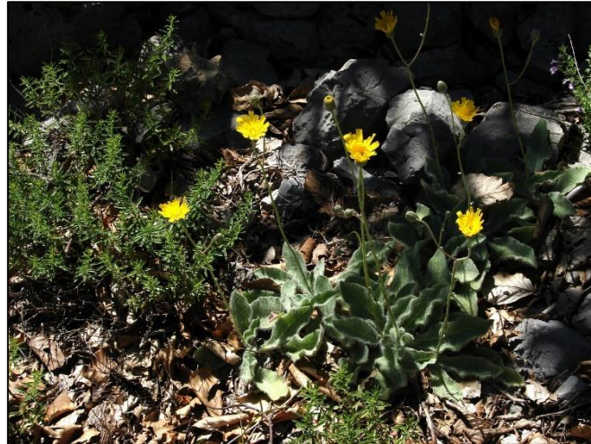
Slika 19. Hieracium waldsteinii

Stabljika je uspravna, jednostavna ili malo razgranata, prekrivena dugim dlakama, visoka do 45 cm. Podanak je kratak i zadebljao. Listovi su sklopljeni u rozetu, jednostavni, ovalno lancetasti, dužine do 8 cm. Cvjetovi su žuti, skupljeni u pojedinačne cvatove. Cvate u julu i augustu. Plod je crna ahenija.