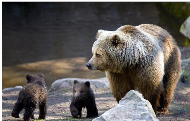
Slika 33. Ursus arctos

Smeđi medvjed ima zdepasto tijelo koje završava kratkim repom, šiljatu njušku, zaobljene uši i oštre zube. Može odvući plijen težak 300 kilograma. Po prehrani je svaštojed. Hrani se drugim životinjama (kukcima, ribama, strvinom i malim sisavcima) jagodama i travom, a katkad i većim životinjama. Smeđi medvjedi teže od 150 kg. Prosječni teritorij svake jedinke iznosi 250 kvadratnih km, a ove životinje vode usamljenički život.