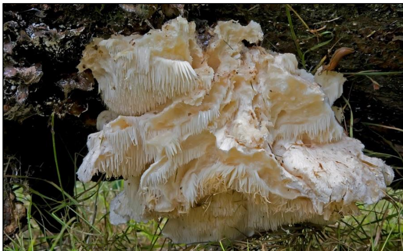
Slika 29. Creolophus cirrhatus

Plodište je do 8 cm veličine, jednogodišnje, konzolasto, polukružno ili lepezasto. Površina je bijela, neravna i prekrivena sterilnim izraštajima. Javlja se na mrtvom drvetu lišćara, a naročito bukve. Rijetka vrsta i vrijedna zaštite.