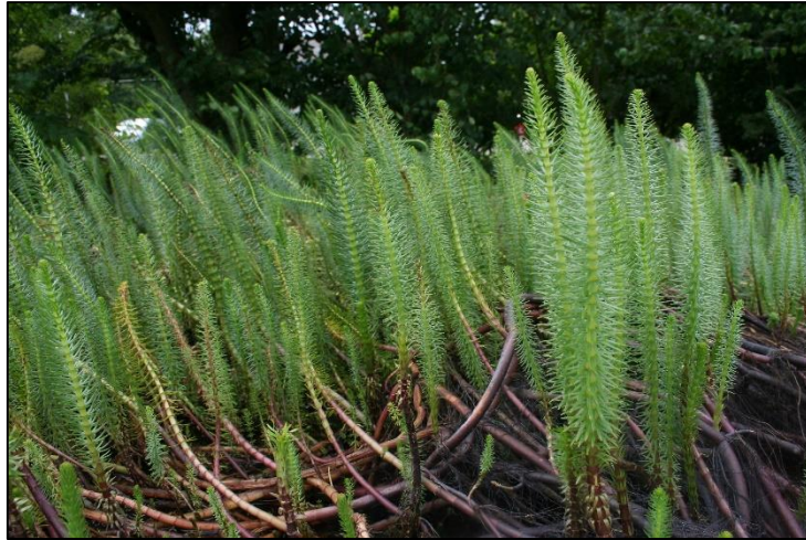
Slika 27. Hippuris vulgaris

Višegodišnja biljka, koja se javlja u močvarama ili potocima. Korijen je pod vodom, ali većina njegovih listova je iznad površine vode. Listovi se javljaju u pršljenovima od 6-12, svijetlozelene su boje. Oni iznad vode su dužine 0,5 do 2,5 cm i širine do 3 mm, dok su oni pod vodom tanji i duži od onih iznad vode. Stabla su čvrsta i nerazvijena, ali često nakrivljena, i mogu biti dugačka do 60 cm. U plitkoj vodi vire 20-30 cm iznad vode. Cvijeće je neupadljivo i ne proizvode ih sve biljke.