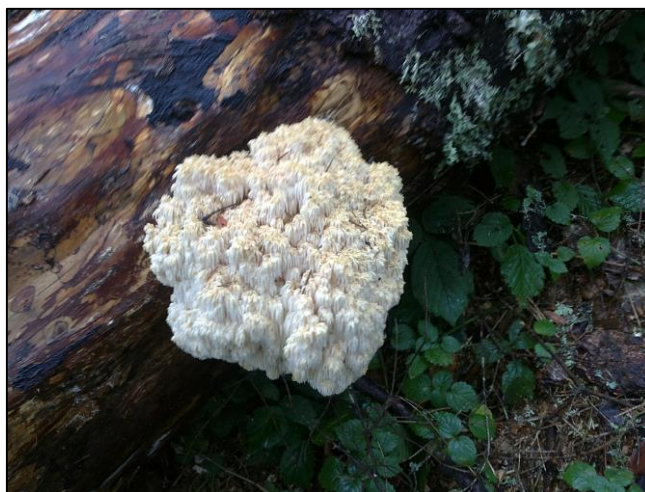
Slika 30. Hericium coralloides (Zahirović, 2018)

Plodište je veličine do 30 cm, koraloidno razgranato iz zajedničke osnove. Izraštaji međusobno nepravilno isprepleteni i tanki, na kraju sa čupercima visećih iglica. Plodište je u početku bjeličasto-kremaste boje, a kasnije žućkast do ružičast. Javlja se od ljeta do kasne jeseni na mrtvim stablima jele ili panjevima.