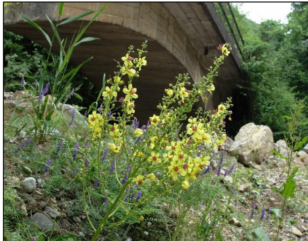
Slika 12. Verbascum bosnense (Šarić, 2018)

Dvogodišnja ili trogodišnja uspravna biljka, visine oko 40-70. Lice svih listova je tamnozeleno, dlakavo ili pak skoro goli. Peteljke prizemnih listova su zadebljale, a oko 3-5. Listovi na stabljici su široki ili izduženo srcoliki. Sezona cvjetanja ove divizme je u maju i junu. Peteljke prvih cvjetova su duge 7-15 mm. Čašica je duga 2-3,5. Plod je čahura, duga 4-5 mm, izdužena ili loptasto elipsoidna, gotovo gola. Sadrži veliki broj sitnih tamnih sjemenki, dužine 0,8-1 mm.