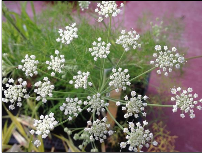
Slika 9. Athamanta haynaldii

Endemska vrsta južne Evrope i sjeverne Afrike. Listovi su svijetlozelene boje. Raste na kamenitim tlima izloženim suncu. Cvjetovi su bijele boje.