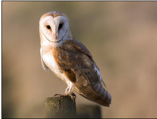
Slika 32. Tyto alba

Kukurvija, kao i sve sove, ima veo oko očiju, kojeg čini radijalno raspoređeno perje. Kod ove je vrste je taj veo bijel i srcastog oblika. Kukurvija je srednje veličine, a sa nogama je duga oko 35 cm. Ženke su krupnije od mužjaka, a prosječna težina im iznosi oko pola kilograma. Leđa su joj narančastosiva sa sivim točkama, a donja strana bijela.