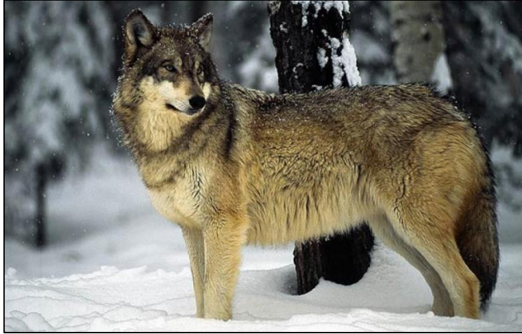
Slika 34. Canis lupus

Veličina i težina vukova se jako razlikuje jer nastanjuju vrlo velika i različita područja. Dosežu dužinu tijela (od vrha njuške do početka repa) do 160 cm, a rep je dugačak još do 52 cm. U ramenima je visok oko 80 cm a mogu doseći težinu do 80 kg.