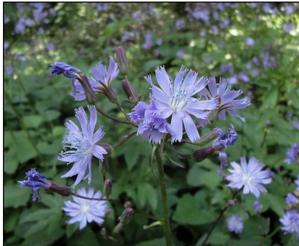
Slika 18. Cicerbita pancicii (Šarić, 2018)

Trajna zeljasta biljka. Stabljika je uspravna, cilindrična, šuplja, visoka do 150 cm. Podanak je valjkast. Listovi su naizmjenični, goli, zelene boje. Gornji listovi su kopljasti, sjedeći. Cvjetovi su dvospolni prečnika do 2,5 cm. Plodovi su rebrasti, dužine do 5 mm. Biljka kada se zareže izlučuje mliječni sok neugodnog mirisa.