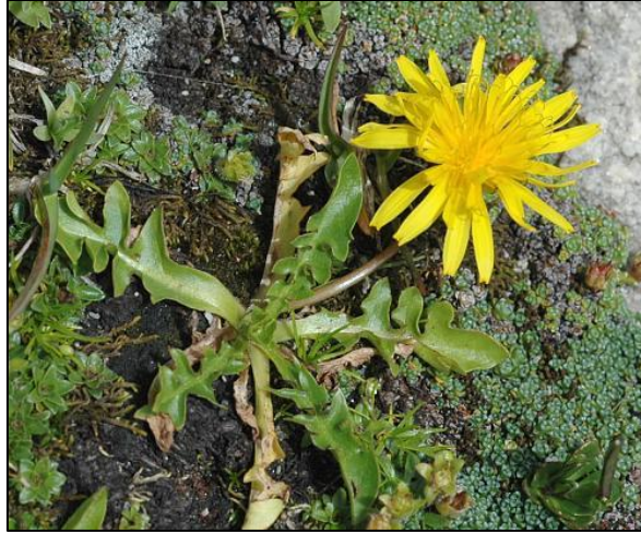
Slika 17. Taraxacum alpinum

Trajna zeljasta biljka. Korijen je vretenast i zadebljan, slabo razgranat. Listovi su uskolancetasti ili linerarni. Stabljika je uspravna, visoka do 25 cm. Cvjetovi su dvospolni, zlatnožute boje, skupljeni u glavice prečnika do 5 cm. Cvate u proljeće.