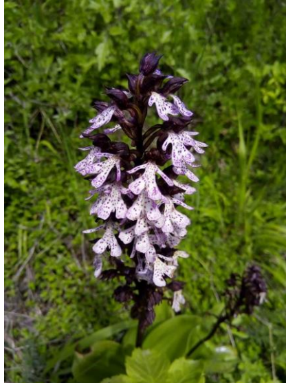
Slika 29. Orchis purpurea (Zahirović, 2018)

Trajna, zeljasta biljka. Stabljika je uspravna, vitka, visoka 30-80 cm. Gomolji su jajoliki sa brojnim debelim, valjkastim korijenima. Prizemni listovi su široko eliptični, dugi oko 20 cm, široki od 2-7 cm, tamnozeleni i sjajni, bez mrlja, a na naličju su svjetliji. Cvjetovi su dvospolni, nepravilni, mirisni, do 50 skupljeno u duguljaste jajaste cvatove dužine do 25 cm. Cvate u maju i junu. Plod je tobolac koji sadrži mnogo malih sjemenki.