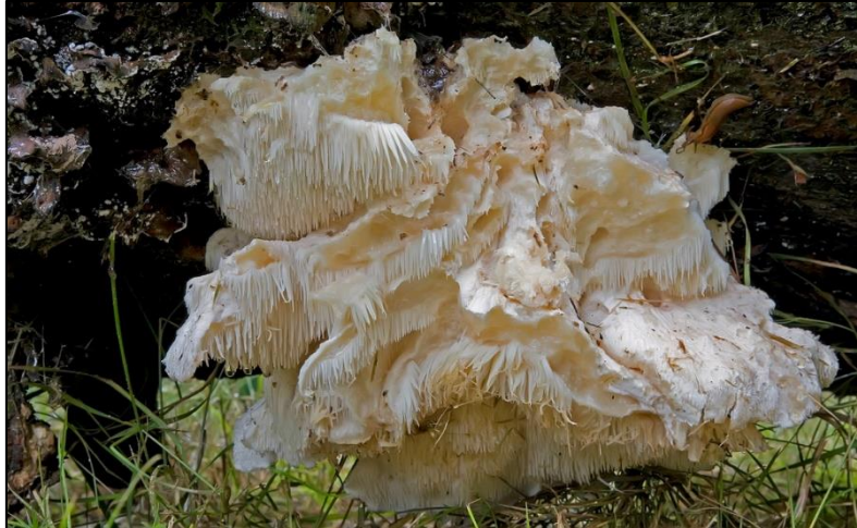
Slika 30. Creolophus cirrhatus

Plodište je do 8 cm veličine, jednogodišnje, konzolasto, polukružno ili lepezasto. Površina je bijela, neravna i prekrivena sterilnim izraštajima. Javlja se na mrtvom drvetu lišćara, a naročito bukve. Rijetka vrsta i vrijedna zaštite.