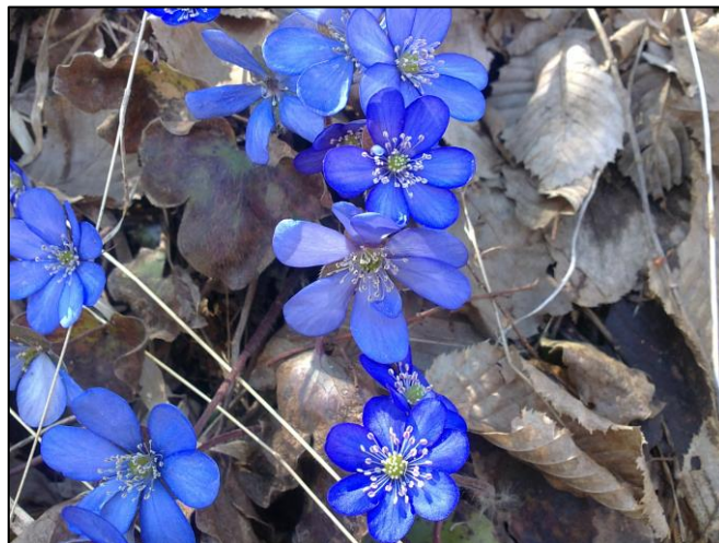
Slika 8. Hepatica nobilis (Zahirović)

Stabljike su uspravne, dlakave, crvenosmeđe boje, visoka do 15 cm. Podanak je kratak, razgranat, horizontalan ili ukošen, tamnosmeđe boje. Čistovi su skupljeni u rozeti, a nalaze se od 5-15 cm dugim peteljčkama, koje su dlakave. Cvjetovi su pojedinačni, dvospolni, prečnika od 1,5-2,5 cm, sastavljeni od 6-10 ovalnih listića, plavkaste do ljubičaste boje. Cvate u martu i aprilu. Plod je jednosjemeni oraščić, dug oko 3 mm.