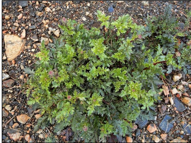
Slika 13. Scrophularia tristis (Šarić, 2018)

Dvogodišnja biljka tankog korijena. Stabljike su visoke oko 20-60 cm, uspravne; naviše od sredine prelaze u usku metlicu. Listovi su skoro gotovo perasto izdijeljeni, sa širokom režnjevima, oštro nazubljeni. Cvjeta u maju i junu, ponekad i u julu. Cvjetići su pojedinačni, na kratkim žljezdastim drškama, koje su kraće od čašice. Krunica je duga 3-4,5 mm. Plod ove zijačice je okruglasta čahura, duga oko 5 mm u kojoj je veći broj crnkastih sjemenki.