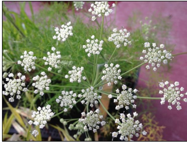
Slika 9. Athamanta haynaldii

Endemska vrsta južne Evrope i sjeverne Afrike. Listovi su svijetlozelene boje. Raste na kamenitim tlima izloženim suncu. Cvjetovi su bijele boje.