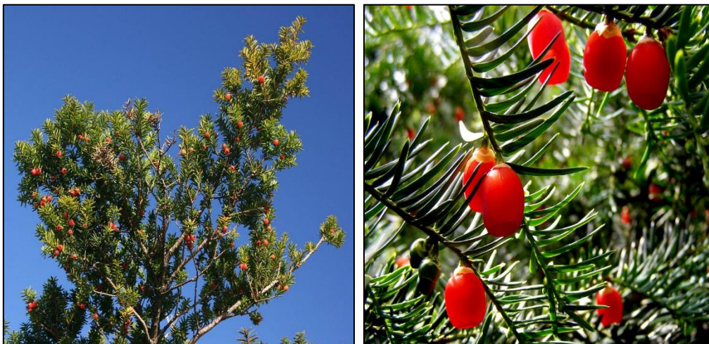
Slika 3 i 4. Stablo tise i izgled ploda

Grm ili srednje visoko drvo, naraste do 20 m. Ima široku piramidalnu krošnju s nepravilnom deblom do 1 m prečnika. Kora je tanka crvenkastosmeđa na starijim stablima uzdužno raspuca. Igljice su većinom češljasto raspoređene pri osnovi sužene. Sjeme tamnosmeđe jajasto i doba zrelosti obavijeno crvenim arilusom.