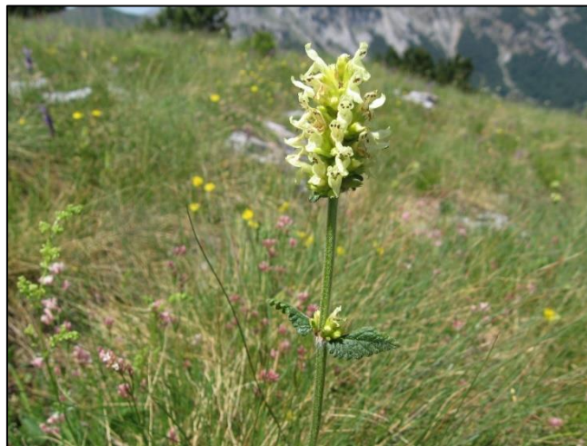
Slika 16. Stachys anisochila

Višegodišnja zeljasta biljka. Stabljika je jednostavna ili uspravna, a naraste do 50 cm visine. Podanak je debeo i kratak. Listovi su dlakavi, sitno nazubljenih rubova, dugi do 10, a široki do 5 cm. Cvjetovi su dvospolni, dužine do 2 cm. Plod je kalavac.