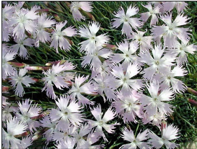
Slika 11. Dianthus petraeus

Ima zeljastu stabiljku visoku do 80 cm. Listovi su zeleni do zeleno-plavi, dugi do 15 cm. Cvjetovi su pojedinačni, bijele boje. Dugi su 3-5 cm.