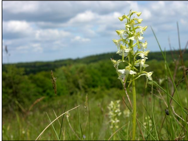
Slika 23. Platanthera chlorantha

Višegodišnja biljka, stabljika je uspravna, okruglasta, visoka do 60 cm. Dva ili rijede tri lista smješteni su pri osnovi stabljike. Listovi su dugi do 20 cm, a široki do 8 cm, naglo suženi u malu peteljku. Cvjetovi su dvospolni, mladi blijedozeleni, do 30 cvjetova je skupljeno je u uspravne valjkaste cvatove, koji su do 25 cm dugi. Cvate od maja do jula. Plod je kapsula sa sjemenkama.