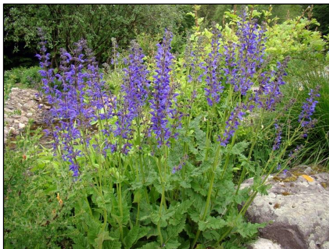
Slika 28. Salvia pratensis

Trajna, zeljasta biljka. Stabljika je šuplja, prekrivena sitnim dlačicama, te je zbog toga ljepljiva na dodir. Jednostavna je ili u gornjem dijelu razgranata, visoka do 70 cm. Korijen je vretenast, odrvenjeo. Prizemni listovi su tamnozeleno boje, naborani, na rubovima nazubljeni, dugački do 15 cm, široki do 7 cm, ovalnog oblika. Cvjetovi su dvospolni, imaju kratku dršku, skupljeni su 4-6 u pršljenove, te čine cvatove veličine do 30 cm. Čaška je zvonasta, tamnosmeđe boje, dok je vjenčić plavoljubičast. Cvate od maja do augusta. Plod je jajoliki kalavac.