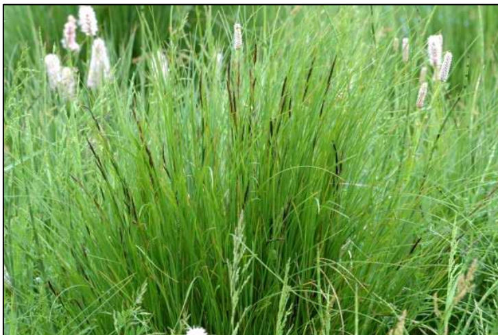
Slika 21. Carex nigra

Raste u vrlo različitim tipovima vegetacije, poglavito na vlažnim i močvarnim staništima. Stabljika im je najčešće trobridna, a listovi slični onima u trava, veličine do 40 cm. Sitni, neugledni cvjetovi, bez razvijena ocvijeća, jednospolni su i najčešće jednodomni, skupljeni su u klasiće koji stoje ili pojedinačno na vrhu stabljike ili, češće, u sastavljenom cvatu. Cvjeta od aprila do juna.