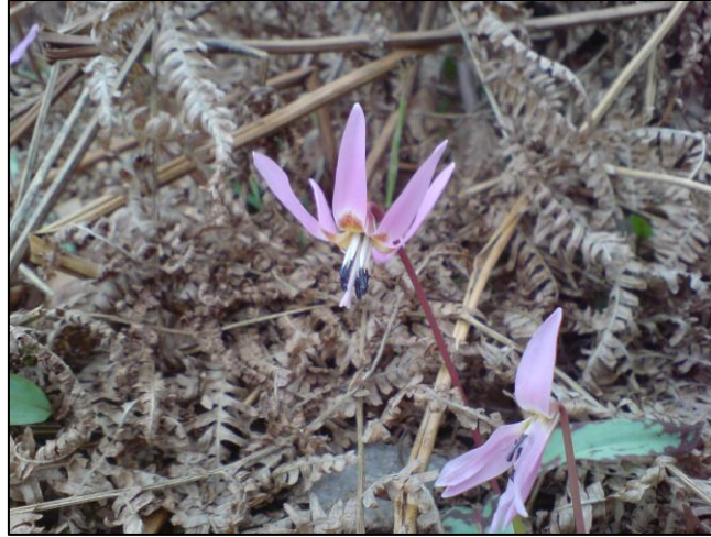
Slika 5. Erythronium dens-canis (Zahirović,2018)

Lukovica spolja sa tankim smeđim omotačem, na prelomu bijela. Razvija bočne lukovice. Stabljika uspravna, jednocvijetna i gola. Listovi goli i pretežno pjegavi. Ima primjenu u narodnoj medicini. Rasprostranjen je u šumama hrasta kitnjaka i običnog graba.