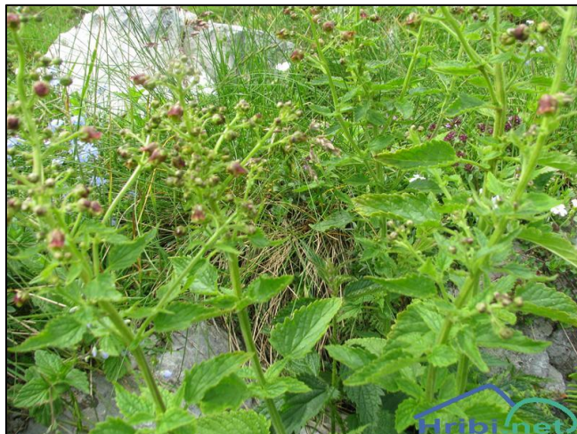
Slika 14. Scrophularia scopolii

Višegodišnja zeljasta biljka. Stabljika je uspravna, visoka do 70 cm. Listovi su nasuprotni, dužine do 8 cm, goli, a donji listovi su dvostruko perasto razdvojeni. Peteljke su dužine do 5 cm. Cvjetovi su pojedinačni, sakupljeni u cvatove na vrhu stabljike.