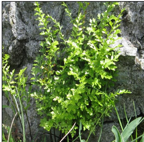
Slika 6. Asplenium cuneifolium

Pripada poluzimzelenim biljkama. Nadzemni cjeloviti ili najčešće razdijeljeni listovi rastu iz podanka, a na donjoj strani su trusne gomilice (sorusi). Često rastu u obalnim predjelima po zidovima i pukotinama stijena.