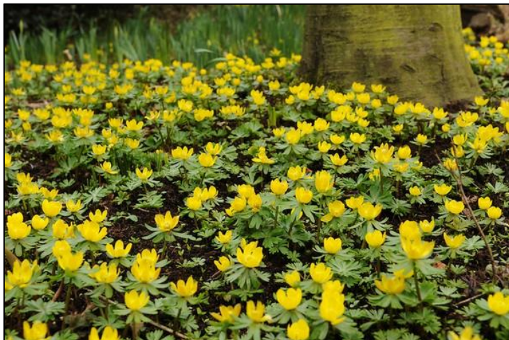
Slika 26. Eranthis hyemalis

Višegodišnja biljka, stabljike su uspravne, šuplje, zelene, a narastu do 15 cm visine. Prizemni listovi se nalaze na dugačkoj peteljci, srcolikog su oblika. Cvjetovi su veliki do 5 cm, sačinjeni od 6 jajolikih žutih latica, veličine do 2 cm. Cvate od kraja februara do aprila. Plod čini nekoliko čahura u kojima se nalaze sjemenke.