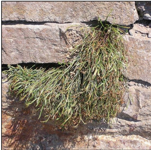
Slika 7. Asplenium septentrionale

Nadzemni cjeloviti ili najčešće razdijeljeni listovi rastu iz podanka, a na donjoj strani su trusne gomilice (sorusi). Često rastu u obalnim predjelima po zidovima i pukotinama stijena.