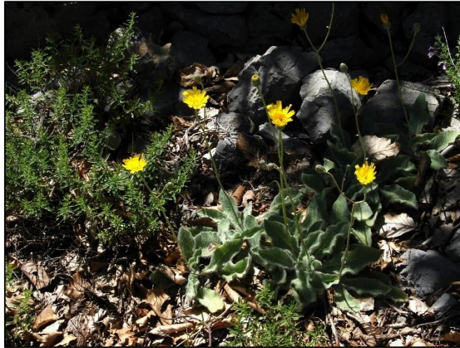
Slika 19. Hieracium waldsteinii

Stabljika je uspravna, jednostavna ili malo razgranata, prekrivena dugim dlakama, visoka do 45 cm. Podanak je kratak i zadebljao. Listovi su sklopljeni u rozetu, jednostavni, ovalno lancetasti, dužine do 8 cm. Cvjetovi su žuti, skupljeni u pojedinačne cvatove. Cvate u julu i augustu. Plod je crna ahenija.