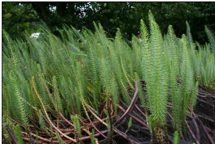
Slika 27. Hippuris vulgaris

Višegodišnja biljka, koja se javlja u močvarama ili potocima. Korijen je pod vodom, ali većina njegovih listova je iznad površine vode. Listovi se javljaju u pršljenovima od 6-12, svijetlozelene su boje. Oni iznad vode su dužine 0,5 do 2,5 cm i širine do 3 mm, dok su oni pod vodom tanji i duži od onih iznad vode. Stabla su čvrsta i nerazvijena, ali često nakrivljena, i mogu biti dugačka do 60 cm. U plitkoj vodi vire 20-30 cm iznad vode. Cvijeće je neupadljivo i ne proizvode ih sve biljke.