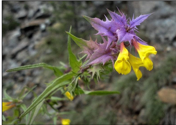
Slika 15. Melampyrum hoermannianum (Šarić, 2018)

Vrsta poluparazita koji od biljke-domaćina dobivaju vodu i hranjive tvari, ali one mogu i same preživjeti bez ovakvog parazitiranja. Stabljika je uspravna, visine do 50 cm. Listovi su nasuprotni, zašiljeni, zelenkaste do ljubičaste boje, a nalaze se na vrlo kratkim peteljka. Cvjetovi su žute boje.