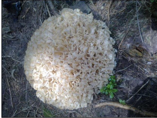
Slika 32. Sparassis nemeci (Janjoš, 2018)

Plodište je veličine do 40 cm, žućkasto-kremaste je boje, grmoliko i razvija se iz zajedničke osnove sa mnogo sitnih, nekad spojenih latica na vrhovima ogranaka. Javlja se u jesen na starim stablima jele ili panjevima, uzročnik smeđe truleži na stablima.