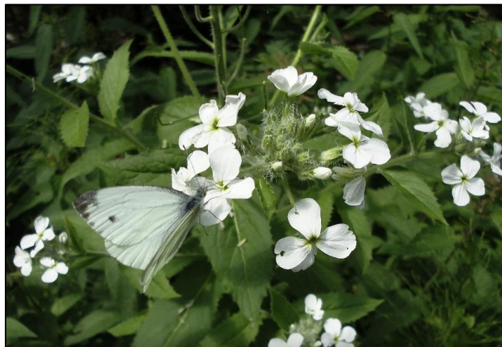
Slika 10. Hesperis dinarica (Šarić, 2018)

Dinarska večernica je višegodišnja zeljasta biljka, visine 70-80, ponegdje i 100 cm, sa odrvenjelim korijenom. Stabljike su joj uspravne, obrasle listovima i jednostavnim račvastim, žljezdastim dlačicama. Cvjeta u junu i julu, kada po više cvjetova formira vršnu grozdastu cvast. Peteljke cvjetova su duge oko 20 mm, gusto žljezdasto-dlakave. Čaška im je bijela, prozirnih rubova. Laticice su snježno bijele, blago mirišljave, a duge oko 17-20 mm. Sjemenke su duge oko 2,5-3 mm duge, a široke oko 1 mm.