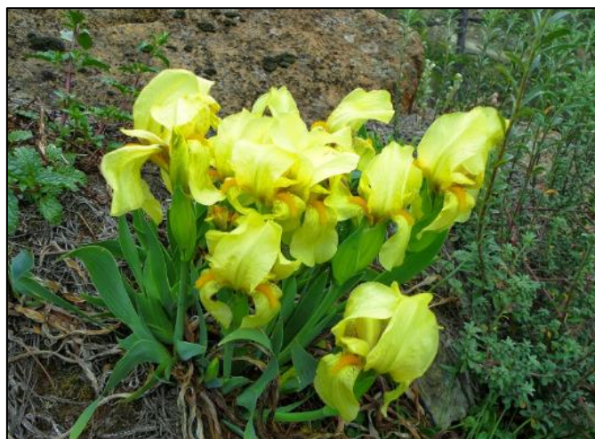
Slika 20. Iris bosniaca

Višegodišnja biljka, koja naraste do oko 10-35 cm. Listovi su pravi ili blago srpasti, oštro zašiljeni, širine 4-15 mm. Cvjeta u maju i junu. Cvjetovi su dvospolni. Ocvijeće čini 6 žutih, pri dnu sraslih, latica. Cijev perigona je duga 1,5-2,5 (3) cm, gotovo dvostruko duža od plodnice, ali je kraća od režnjeva. U donjoj trećini gornje strane uočava se red žutih dlaka. Unutrasnji režnjevi su klinasti ili jajoliki. Plod je tobolac sa 3 poklopca, dužine 50-60 mm, a otvara se uzdužno, te sadrži mnogo svijetlosmeđih, okruglih sjemenki.