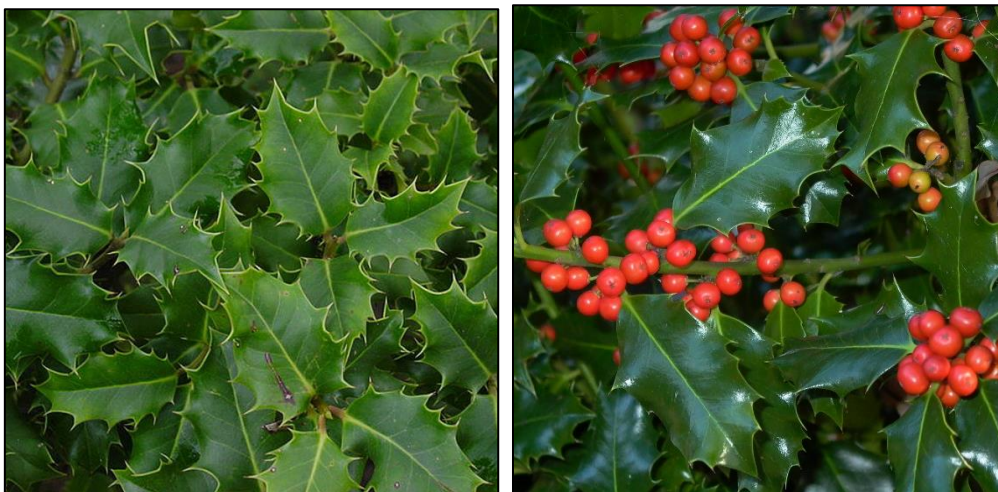
Slika 1 i 2. Izgled grma i ploda božikovine

Grm ili nisko drvo oko 5 m (rijetko 10 m) i prsnog promjera do 30 cm. Koža tanka tamnozeleno do pepeljasto siva. Listovi su uvijek zeleni, kožasti, sjajni tamnozeleni na licu, mstoje u pazuhu listova, imaju oblik paštastih cvasti. Plod mu je okrugla koštunica, veličine zrna graška, crvene boje (nije jestiva).