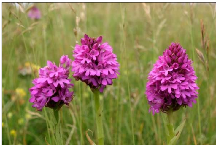
Slika 24. Anacamptis pyramidalis

Višegodišnja biljka, stabljika je uspravna, tanka, naraste do 60 cm. Listovi su naizmjenični, duguljasti, dugi do 20 cm, cjelovitog ruba, obavijaju stabljiku pri osnovi, nemaju mrlje. Cvjetovi su dvospolni, mnogobrojni, skupljeni na vrhu stabljike u grozdasti cvat koji je do 8 cm dug. Cvat je u početku piramidalan, a kasnije postaje jajolik. Cvjetovi su ružičaste boje, a ispuštaju miris koji je sličan vaniliji. Cvate od maja do augusta. Plod je tobolac koji nosi puno sitnih sjemenki.