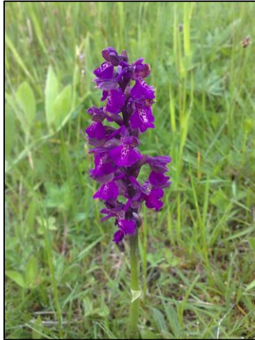
Slika 25. Orchis macula (Zahirović, 2018)

Višegodišnja biljka, stabljika je uspravna, valjkasta, vitka, svijetlozelena, visoka do 60 cm. Listovi su uspravni, jajoliki ili kopljasti, naizmjenični, prekriveni tamnosmeđim pjegama, dužine do 10 cm. Cvjetovi su dvospolni, nepravilni, svijetloljubičasti, do 50 ih je skupljeno u uspravne valjkaste cvatove, koji su dugi do 15 cm. Cvate u junu i julu. Plod je kapsula koja sadrži mnogobrojne sitne sjemenke.