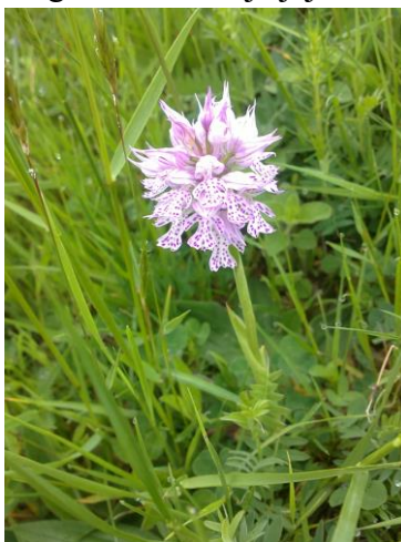
Slika 22. Orchis tridentatus (Zahirović, 2018)

Višegodšnja je biljka. Stabljika je uspravna, svijetlosiva, visoka 10-40 cm. Gomolji su kuglasti ili duguljasti. Listovi su lancetasti, prizemnih listova ima 5-6, dok ih je 1-2 na stabljici. Cvjetovi su skupljeni u guste, u početku okruglaste, a kasnije jajaste cvatove.